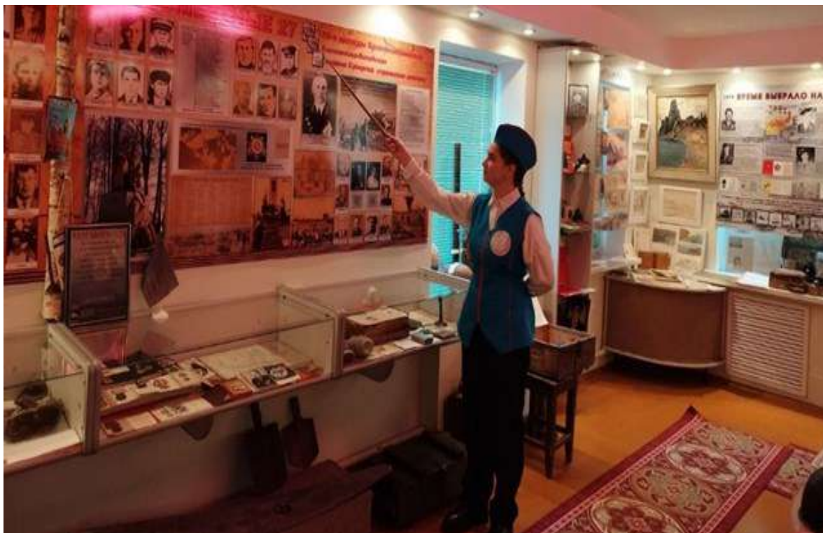
Музей Вороновской средней школы